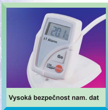
Vysoká bezpečnost nam. dat