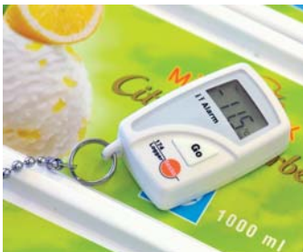
... ve chladících regálech a vitrínách