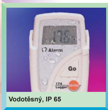
Vodotěsný, IP 65