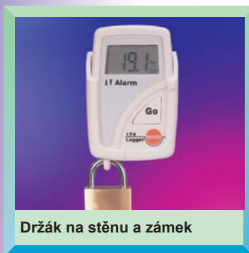
Držák na stěnu a zámek