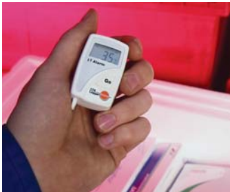
... při transportu - v kontajnech