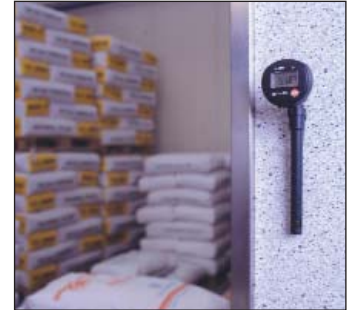
Kontrola podmínek skladování potravin